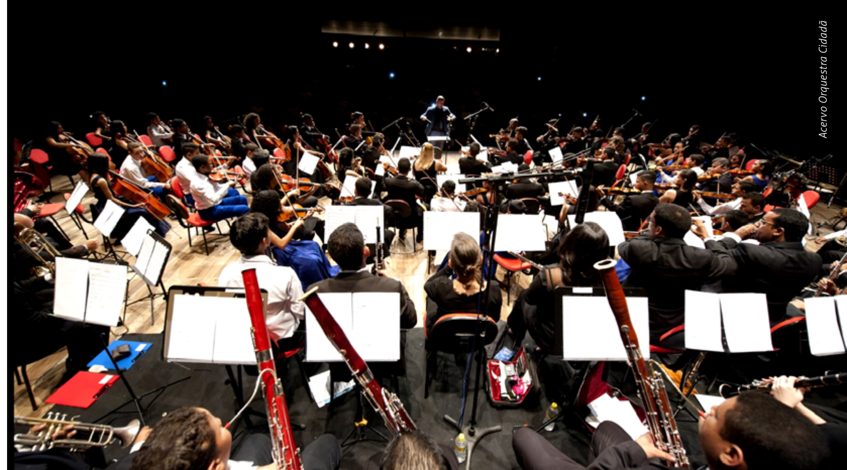
Acervo Orquestra Cidadã

Signatária de diversos compromissos internacionais, nacionais e regionais, a Chesf participa do Pacto Global da ONU, dos Princípios de Empoderamento das Mulheres (ONU Mulheres), da Declaração de Compromisso da Eletrobras sobre Mudanças Climáticas e