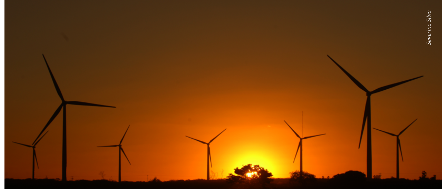
Complexo Eólico Chapada do Piauí