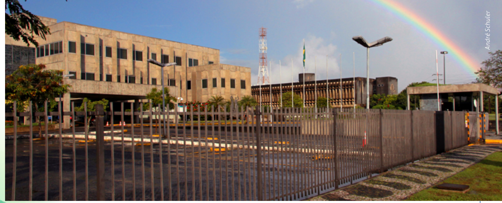
Sede da Chesf no Recife